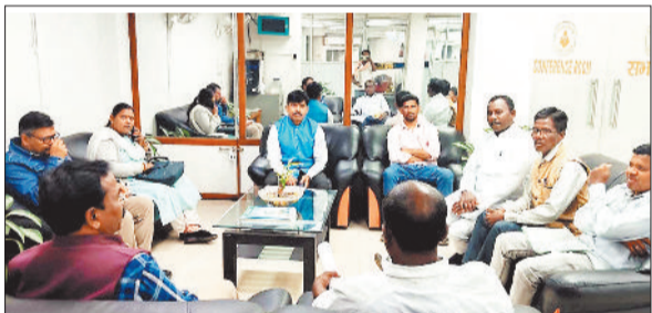
बैठक में शामिल प्रतिनिधि मंडल व बोर्ड मेंबर।

तकनीकी से चर्चा की। इस दौरान प्रतिनिधि मंडल ने सरईपाली, बूड़बूड़ और बरोद में दी गई बड़ी हुई राशि की तरह ही अन्य क्षेत्रों में भी मुआवजा राशि दिए जाने सहित अन्य मांगों को रखी। जिस पर बोर्ड मेंबरों ने अधिकांश विषयों पर विचार करते हुए उचित कदम उठाने का आश्वासन दिया।