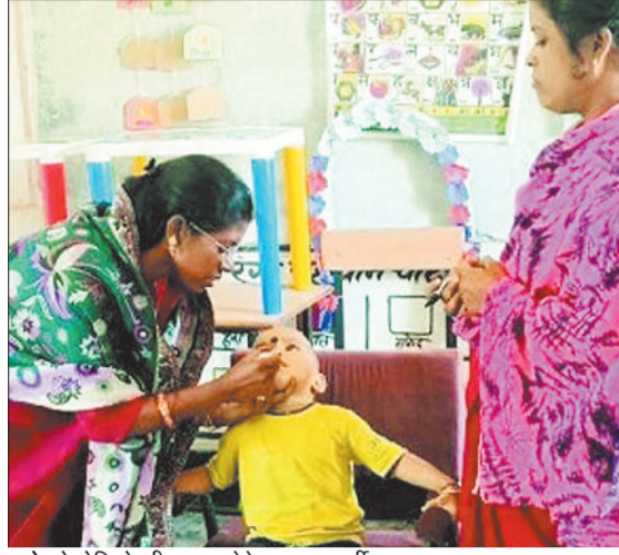
बच्चे को पोलियो की खुराक देते स्वास्थ्य कर्मी।

केन्द्र सरकार के राष्ट्रीय अभियान के अंतर्गत पल्स पोलियो टीकाकरण के प्रथम चरण का आयोजन रविवार को जिले भर में आयोजित किया गया। इस दौरान 5 वर्ष तक के बच्चों को पोलियो की दवा पिलाई गई। अभियान के क्रियान्वयन में स्वास्थ्य विभाग के कर्मचारियों के साथ आंगनबाड़ी कार्यकर्ता, मितानिन, एएनएम, आशा कार्यकर्ता एवं नर्सिंग छात्राओं की सक्रिय भागीदारी रही। जिले के प्रमुख स्थानों पर जनप्रतिनिधियों द्वारा बच्चों को पोलियो ड्रॉप पिलाकर अभियान का शुभारंभ किया गया। स्वास्थ्य विभाग ने शासन से प्राप्त दिशा निर्देशों के अनुसार शहरी और ग्रामीण दोनों क्षेत्रों में अभियान संचालन किया। बीते कुछ दिनों से अभियान को लेकर व्यापक प्रचार-प्रसार किया गया, जिससे लोगों में जागरूकता बनी और अभिभावकों ने अपने बच्चों को टीकाकरण के लिए स्वयं आगे आए। अभियान को सुचारु रूप से संचालित करने के लिए पहले से ही पोलियो ड्रॉप की पर्याप्त व्यवस्था की गई थी। रविवार की सुबह 8 बजे से जिले के सभी सरकारी एवं निजी अस्पतालों, आंगनबाड़ी केंद्रों, रेलवे स्टेशनों, आर्य समाजों, सामुदायिक भवनों और अन्य सार्वजनिक स्थानों पर पोलियो बूथ