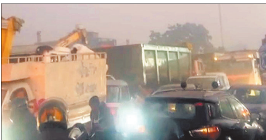
मार्ग पर लगी जाम व वाहनों की कतार।

शनिवार की शाम लगे इसी तरह के जाम में एक एंबुलेंस फंस गई, जिसमें मरीज को जिला मेडिकल अस्पताल ले जाया जा रहा था। एम्बुलेंस घंटों तक जाम में फंसी रही, जिसके बाद स्थानीय पार्षद एवं अन्य लोगों ने कड़ी मशकत कर