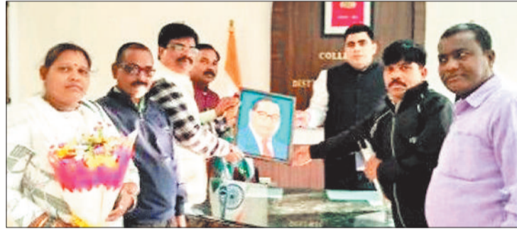
कलेक्टर को ज्ञापन सौंपते भूविस्थापित।